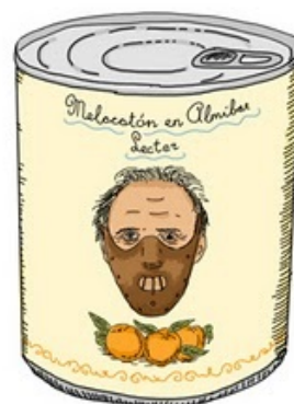
MELOCOTÓN EN ALMÍBAR LECTOR

* Si has rebut aquest email per error o desitjes donar-te de baixa fes click aquí , * Si desitjes donar-te de alta a la nostra newsletter fes click aquí .