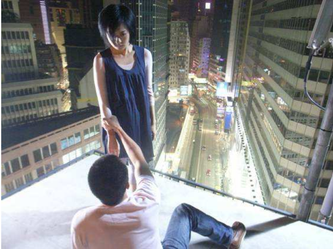
La ciutat sense beisbol de Lawrence Lau

barreja el tema de l'esport i l'enamorament. També s'inclouen dos documentals, True Women For Sale , de Herman Yau, i This Darling Life , d'Angie Chen. S'amplia així la visibilitat d'una producció cinematogràfica que no acostuma a ser tan habitual als circuits comercials europeus com voldríem que ho fos.